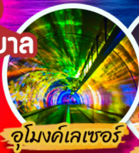
จูมงด์เลเซอร์