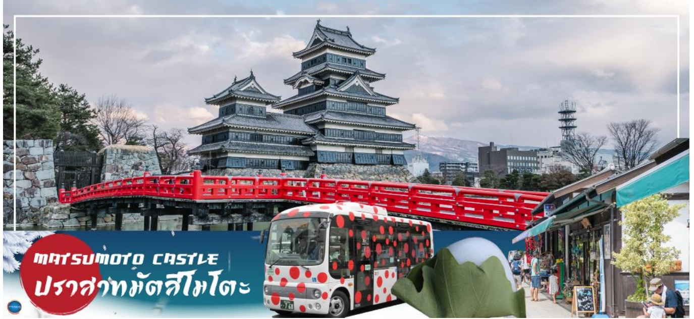
Matsumoto Castle ปราสาทมัตสึโมโตะ

เช้า รับประทานอาหารเช้า ณ ห้องอาหารของโรงแรม (4) นำท่านชม ปราสาทมัตสึโมโตะ (Matsumoto Castle) (ด้านนอก) (ใช้เวลาเดินทางประมาณ 10 นาที) เป็น 1 ใน 12 ปราสาทดั้งเดิมที่ยังคงสภาพสมบูรณ์และสวยงามที่สุดของประเทศญี่ปุ่น และเป็น 1 ใน 5 ปราสาทที่ได้รับการขึ้นทะเบียนเป็นสมบัติประจำชาติ เป็นปราสาทที่สร้างอยู่บนพื้นที่ราบ มีเอกลักษณ์ตรงที่มีหอคอยและป้อมปืนเชื่อมต่อกับโครงสร้างอาคารหลัก และเนื่องจากผนังปราสาทมีสีดำและปีกด้านต่างๆ ของปราสาทแผ่กางออกเหมือนปีกนก เลยมีชื่อเรียกว่า คาราซุโจ ที่แปลว่า ปราสาทอีกา สำหรับข้างในตัวปราสาทมีชั้นบันไดสูงชันและเพดานที่ไม่สูงมาก บริเวณทางเดินจัดแสดงวัสดุเครื่องใช้ทางประวัติศาสตร์ เช่น ชุดเกราะซามูไรสมัยเซ็นโกกุ, ปืนคาบศิลาและอาวุธที่เคยใช้สู้รบในสมัยก่อน หน้าต่างเป็นหน้าต่างไม้แคบๆ มีช่องสำหรับยิงปืนและยิงลูกธนู ท่านสามารถเพลิดเพลินกับทัศนียภาพของเทือกเขาแอลป์ญี่ปุ่นและเมืองมัตสึโมโตะได้จากชั้นบนสุดของปราสาทแห่งนี้ นำท่านสู่ เมืองกุโจฮาจิมาง (Gujohachiman) (ใช้ระยะเวลาในการเดินทางประมาณ 3 ชั่วโมง) เสน่ห์ของที่นี่เต็มไปด้วยกลิ่นอายวัฒนธรรมแบบญี่ปุ่น มีทั้งเมืองเก่าที่เรียงรายกัน และมีรางน้ำจำนวนมากจนถูกเรียกว่าเป็นเมืองแห่งสายน้ำ