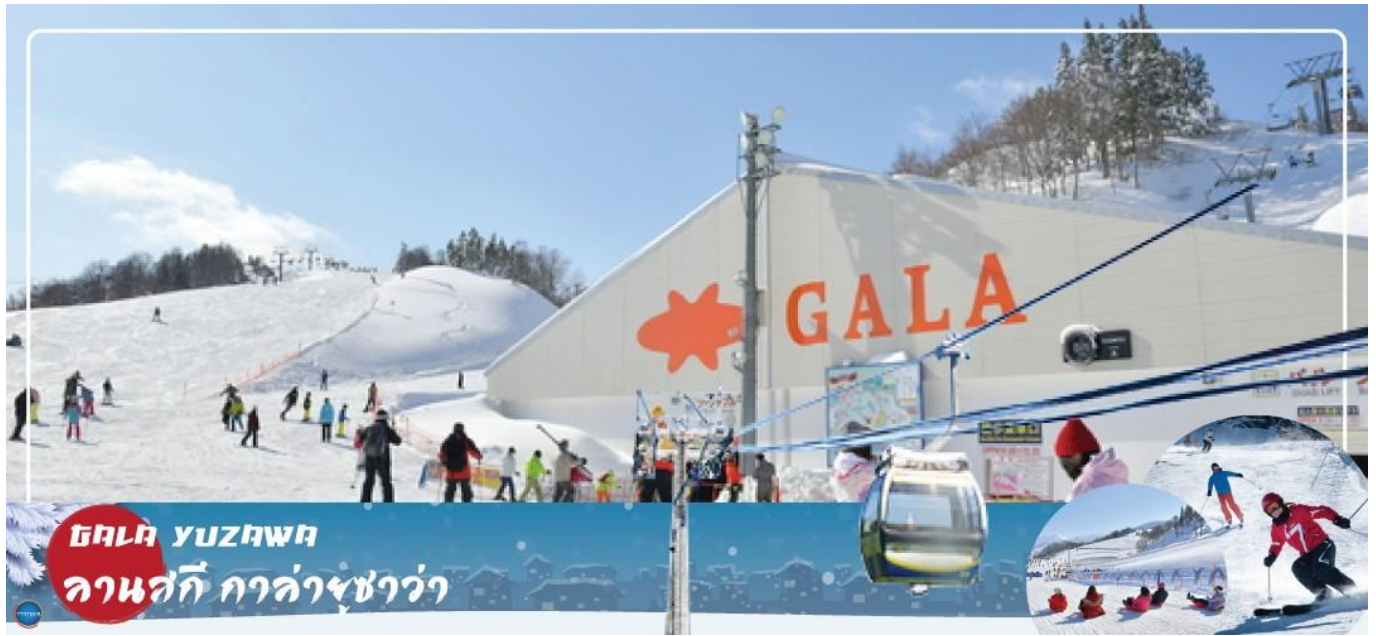
GALA YUZAWA ลานสกี กาล่ายูซาว่า

วันที่สี่ เมืองกุนมะ – เมืองยูซาว่า – ลานสกี กาล่ายูซาว่า (GALA YUZAWA) – วัดโชรินซัง ดารุมะจิ – กรุงโตเกียว – ย่านโอไดบะ – ห้างไดเวอร์ซิตี