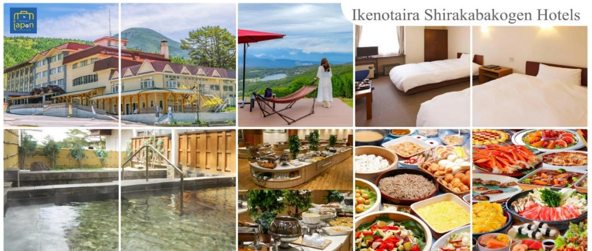
Ikenotaira Shirakabakogen Hotels

รับประทานอาหารค่ำ ณ ภัตตาคาร ของโรงแรม (5) --- บุฟเฟ่ต์นานาชาติ หลังอาหารให้ท่านได้ผ่อนคลายกับการแช่น้ำแร่ธรรมชาติ เชื่อว่าถ้าได้แช่น้ำแร่แล้ว จะทำให้ผิวพรรณสวยงามและช่วยให้ระบบหมุนเวียนโลหิตดีขึ้น