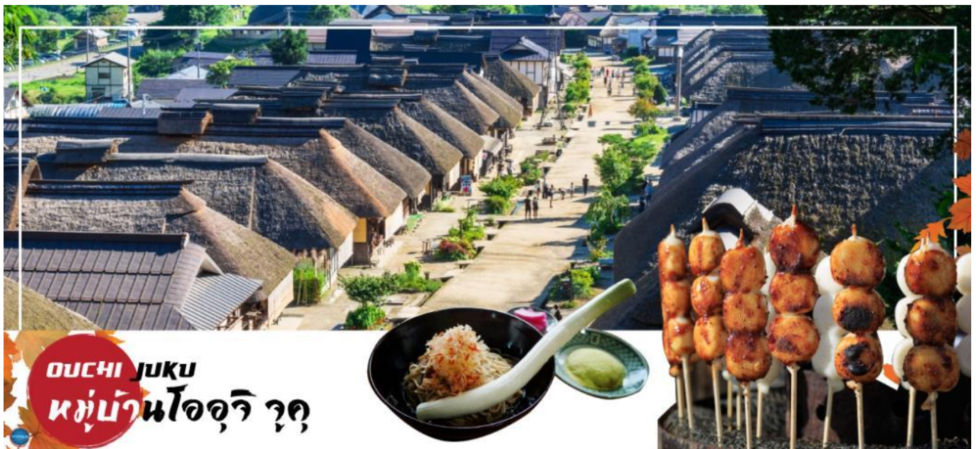
OUCHI JUKU หมู่บ้านโออุจิ จุก

บริเวณใกล้เคียงก็นำท่านสู่ สถานีรถไฟยุโนคามิ ออนเซน (Yunokami Onsen Station) (ใช้เวลาเดินทางประมาณ 10 นาที) โดยเป็นสถานีรถไฟเพียงแห่งเดียวของญี่ปุ่นที่มีอาคารสถานีทำจากหลังคาแบบญี่ปุ่นโบราณ !!!ไฮไลท์ อิสระให้ท่านเพลิดเพลินกับการแช่เท้าผ่อนคลายตามอัธยาศัย ณ จุดออนเซนเท้าที่สถานีแห่งนี้