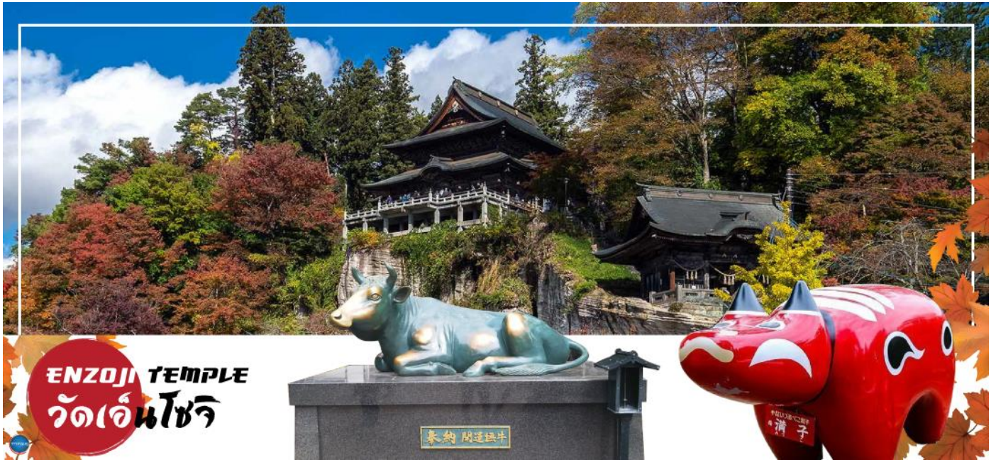
ENZOJI TEMPLE วัดเอ็นโซจิ

เดินทางสู่ เมืองยุโนะคามิ ออนเซน (ใช้เวลาเดินทางประมาณ 1 ชั่วโมง) เป็นเมืองตากอากาศออนเซนเล็กๆ ที่มีชื่อเสียงของจังหวัดฟุกุชิมะ