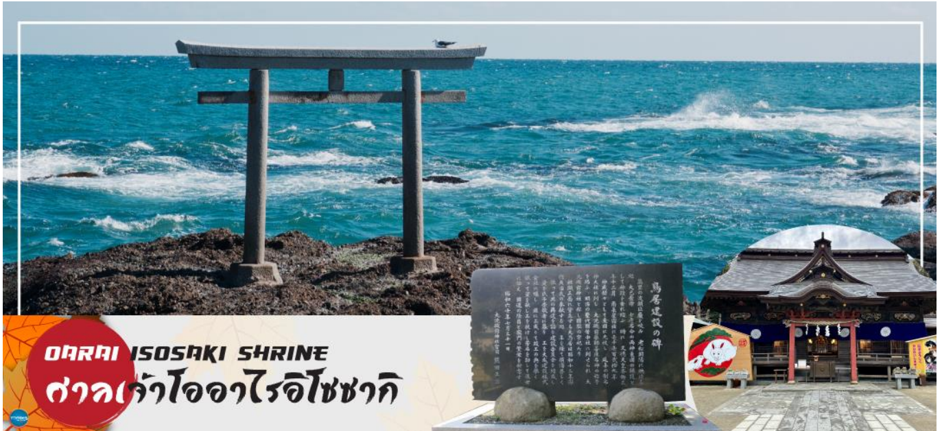
OARAI ISOSAKI SHRINE ศาลเจ้าโออาไรอิโซซากิ

08.10 น. เดินทางถึง ท่าอากาศยานนานาชาตินาริตะ ประเทศญี่ปุ่น หลังจากผ่านขั้นตอนศุลกากร เรียบร้อยแล้ว แล้ว (เวลาที่ญี่ปุ่น เร็วกว่าเมืองไทย 2 ชั่วโมง กรุณาปรับนาฬิกาของท่านเพื่อความสะดวกในการนัดหมายเวลา) ***สำคัญมาก!! ประเทศญี่ปุ่นไม่อนุญาตให้นำอาหารสดจำพวก เนื้อสัตว์ พืช ผัก ผลไม้ เข้าประเทศ หากฝ่าฝืนมีโทษปรับและจับหลังผ่านขั้นตอนการเข้าประเทศแล้ว นำท่านออกเดินทางสู่ จังหวัดอิบารากิ (Ibaraki) (ใช้เวลาเดินทางประมาณ 1.40 ชั่วโมง) ตั้งอยู่ในภูมิภาคคันโตของเกาะฮอนชู ประเทศญี่ปุ่น อิบารากิซึ่งอยู่ไม่ห่างจากโตเกียว เต็มไปด้วยสถานที่ท่องเที่ยวอันสวยงามมากมาย โดยเฉพาะเทศกาลที่เกี่ยวข้องกับดอกไม้ ที่มีให้ชมตลอดทั้งปี นอกจากนี้ยังเป็นจังหวัดที่มีการผลิตนัตโตะ หรือ ถั่วเน่าญี่ปุ่น มากที่สุดในญี่ปุ่นอีกด้วย จากนั้นออกเดินทางสู่ ตลาดปลาโออาไร (Oaraicho) ท่านสามารถชิมอร่อยกับอาหารทะเลสดใหม่ส่งตรงมาจากท่าเรือประมงโออาไร อาทิ ข้าวหน้าปลาดิบ หรืออาหารทะเลปิ้งย่าง นอกจากนี้ยังมีอาหารทะเลตากแห้งที่ทำเองโดยชาวประมง ซึ่งเหมาะสำหรับเป็นของฝากอีกด้วย อิสระรับประทานอาหารทะเลสดๆ แบบปิ้งย่าง เพลิดเพลินกับหลากหลายเมนู ปลาสดๆ เช่น ปลาอังโค ปลาชิราสุ (ปลาข้าวสาร) ตามแต่ฤดูกาล หอยเชลล์ หอยตลับ หอยนางรม หมึกย่างเนย และกุ้ง เป็นต้น