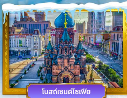
โบสถ์เซนต์โซเฟีย