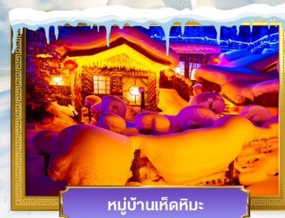
หมู่บ้านหิมะหิมะ

เดินทางโดย : สายการบินโซน่าเซาเทิร์นแอร์ไลน์