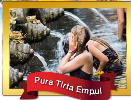
Pura Tirta Empul