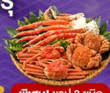
พิเศษ! ว่างู 3 ชนิด