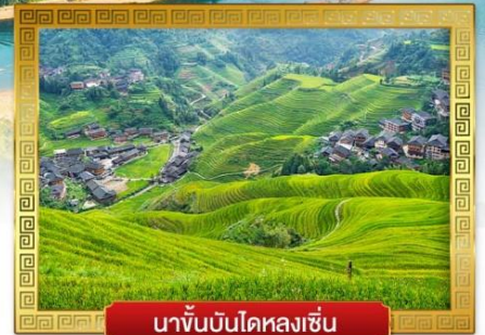
นาขั้นบันไดหลงเซิน