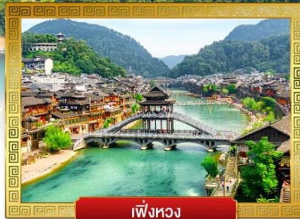
เฟิ่งหวง