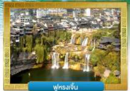
พูหงเจิน