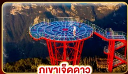
ภูเขาดาว

หมู่บ้านโบราณริมน้ำตก "ฟุรงเจิ้น" สัมผัสเสน่ห์จางเจียเจีย มหัศจรรย์ทางธรรมชาติ