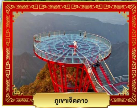
ภูเขাজิตดาว