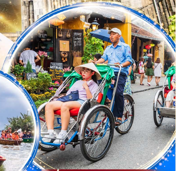
นั่งรถสามล้อฮิโกล์