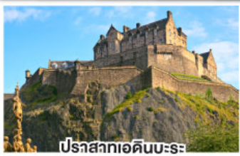
ปราสาทเอดิเนบะระ