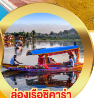
ล่องเรือชิคาร์่า