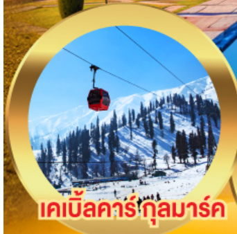
เคเบิลคาร์ คุลมาร์ค