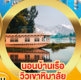
นอนบ้านเรือ วิวเขาหิมาลัย