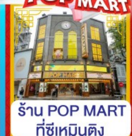
ร้าน POP MART ที่ซีเหมินติง