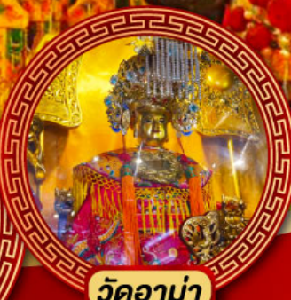
วัดอาม่า