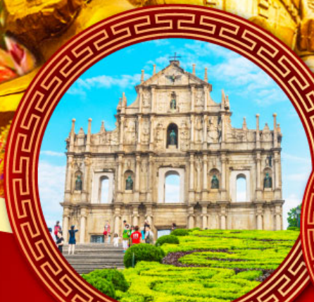
โบสถ์เซนต์ปอล