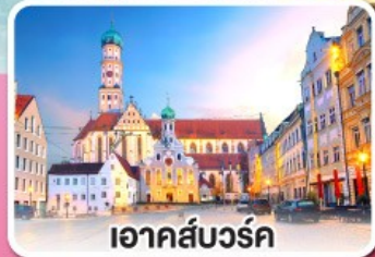
อาคส์บวร์ค