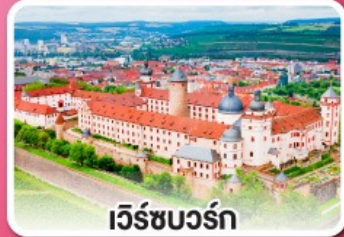
เว็ร์ชบวร์ค