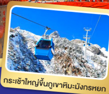
กระเช้าใหญ่ขึ้นภูเขาหิมะมังกรหยก