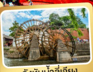
กังหันน้ำลี่เจียง