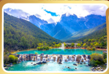
หุบเขาน้ำเงินทะเลสาบไป๋ซุยเหอ