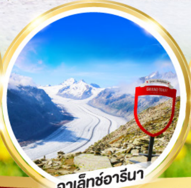
อาเล็กซ์อาร์นา