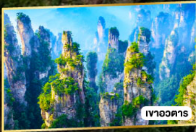
เขาวงตาร