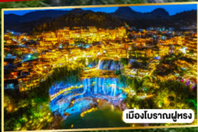
เมืองโบราณฝูหรง

เฟิ่งหวง ฝูหรงเจิ้น มนตร์งลิ่งแห่งขุนเขา และเมืองโบราณ 5 วัน 4 คืน