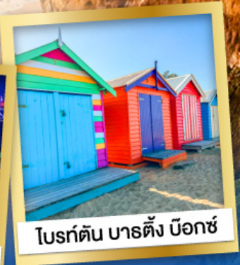
ไบรด์ตัน บาร์ตัง บ็อกซ์

03-10, 12-19 เม.ย.68 24 เม.ย.-01 พ.ค.68 08-15, 22-29 พ.ค.68 29 พ.ค.-05 มิ.ย.68