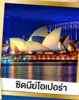
ซิดนีย์โอเปอร์่า