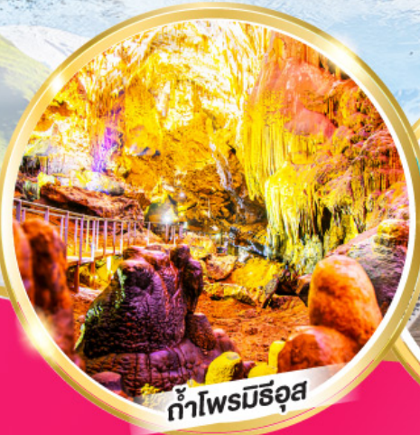
ถ้ำไฟรมิธอส