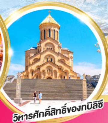
วิหารศักดิ์สิทธิ์ของทบิลีซี