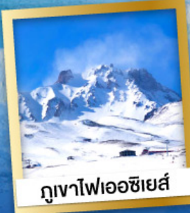
ภูเขาไฟเออเซียส์