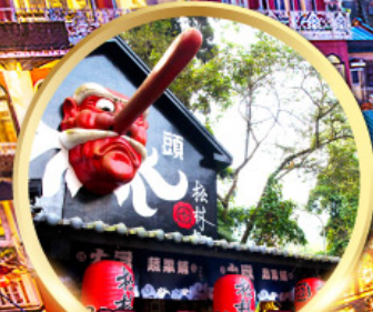
หมู่บ้านปศางชโก