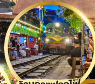
ร้านกาแฟโฟ