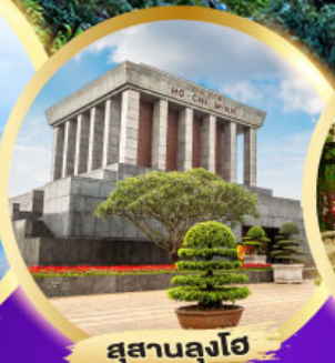
สุสานลูงโฮ