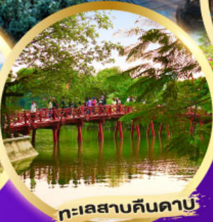
ทะเลสาบคินคาบ