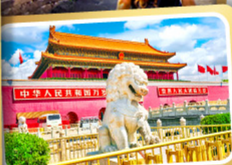
จุดริสเทียนอันเหมิน