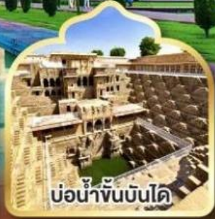
บ่อน้ำหินบันได