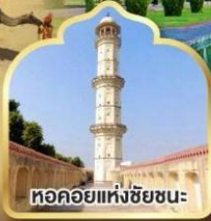
หอคอยแห่งชัยชนะ