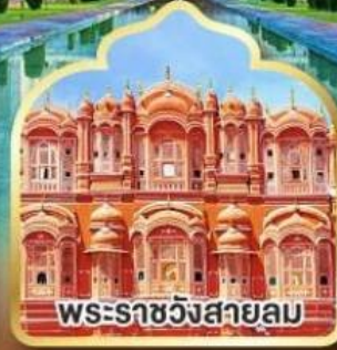
พระราชวังสายลม