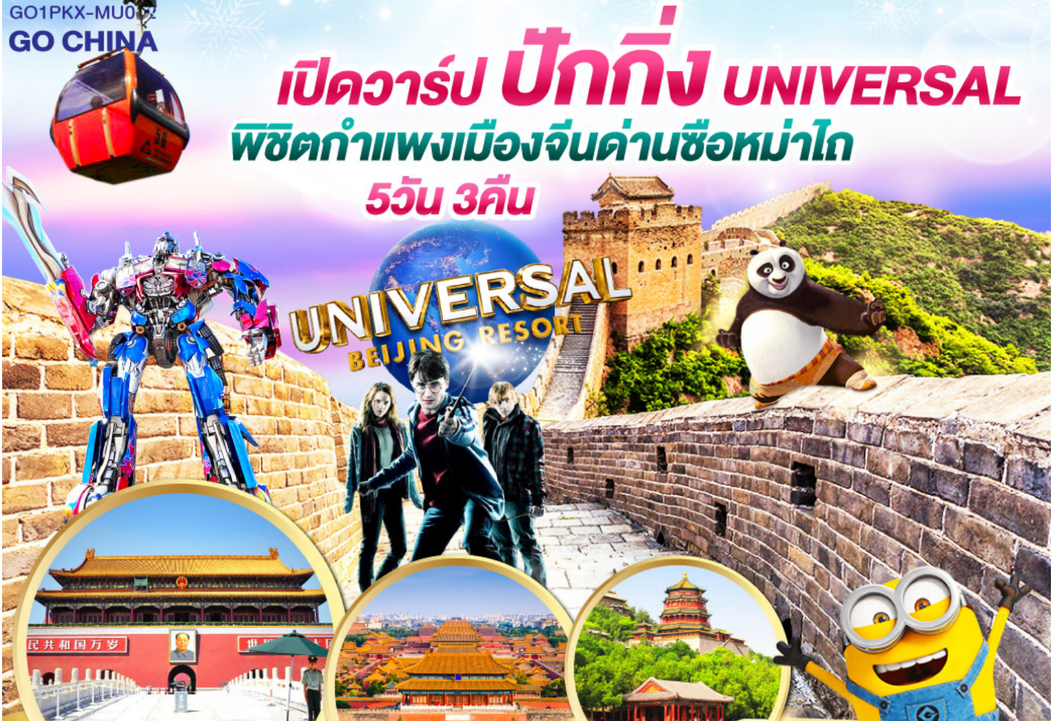
เทียนอันเหมิน