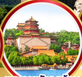
พระราชวังฤดูร้อน อ้อหอยวน