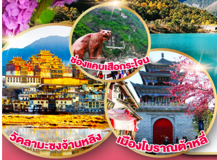
ช่องแคบเสีอกระโจน