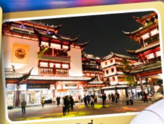
ตลาดร้อยปีเจียงหวิงเหมียว