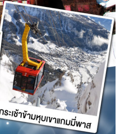
กระเช้าข้ามหุบเขาแกมมีพาส

18-24 ก.พ. 68 11-17 มี.ค. 68 29 เม.ย.-05 พ.ค. 68