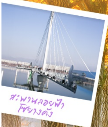
สะพานลอยฟ้า โซฮางคัง