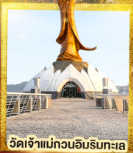
วัดเจ้าแม่กวนอิมริมทะเล