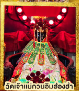
วัดเจ้าแม่กวนอิมฮ่องอ่า