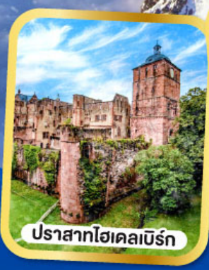
ปราสาทไฮเดิลเบิร์ก