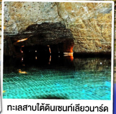
ทะเลสาบใต้ดินเซนต์เลียวนาร์ด

ส่องเรือชมทะเลสาบใต้ดินเซนต์เลียวนาร์ด ทะเลสาบใต้ดินลึกลับ สุดUnseenแห่งสวิตเซอร์แลนด์