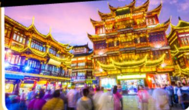
ตลาดร้อยปีฉางหวงเหมียว