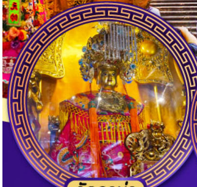
วัดอาม่า