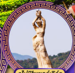
จูไห่พิพิธภัณฑ์