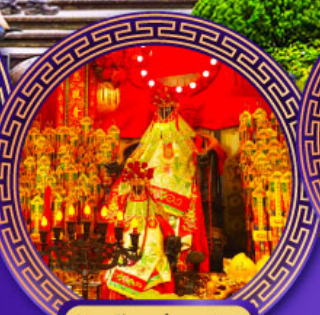
วัดเจ้าแม่กวนอิม ฮ่องกง