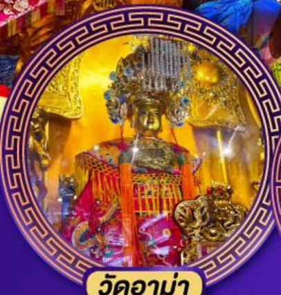
วัดอาม่า