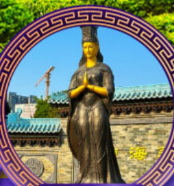
วัดเจ้าแม่ทับทิม