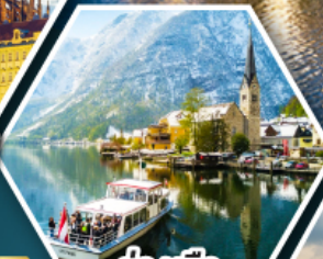
ล่องเรือ ทะเลสาบอัลสติก