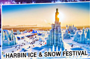
HARBIN ICE & SNOW FESTIVAL