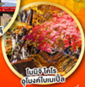
โมมิจิโคโร อุโมงค์ไบเมเปิล

เที่ยวเต็มทุกวัน ไม่มีฟรีคีย์ พักออนเซ็น 2 คืน พักโตเกียว 1 คืน บินเข้านาโงย่า-ออกโตเกียว