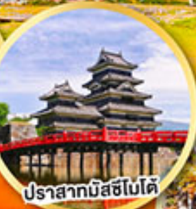
ปราสาทมิสึชิโนะอิ