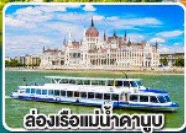
ล่องเรือแม่น้ำดานูบ