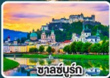
ซาลซ์บูร์ก

มือพิเศษแสนอร่อย เปิดปีกกึ่ง , เปิดโบฮีเมีย และหมุกอดเวียนนา