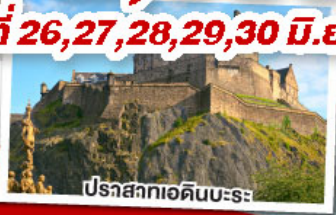
ปราสาทเอดินบะระ