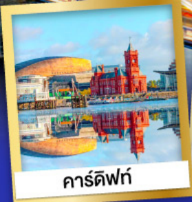
คาร์ดิฟฟ์