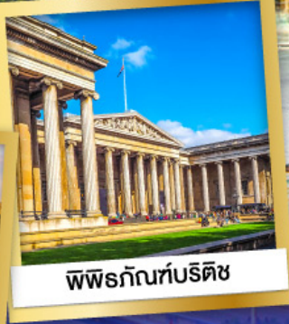
พิพิธภัณฑ์บริติช