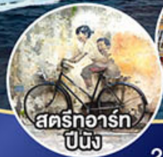
สตรีทอาร์ต ปันัง