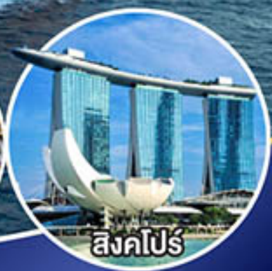
สิงคโปร์