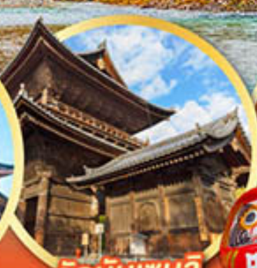
วัดนันเซนจิ