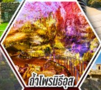
ลำไพลมีริอุส