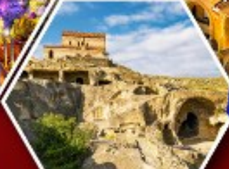
เมืองดำอพิลสตีเคห์

พัก Rooms Hotel โรงแรมวิวหลักล้านของเทือกเขาคอเคซัส