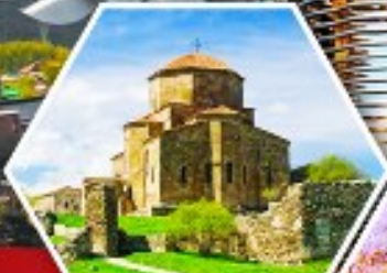
วิหารจอร์ยี