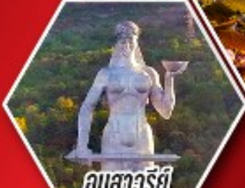
อนุสาวรีย์