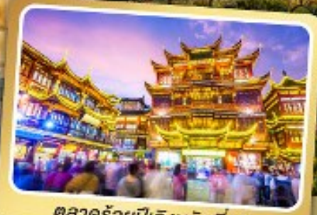
ตลาดร้อยปีเฉิงหวงเหมียว