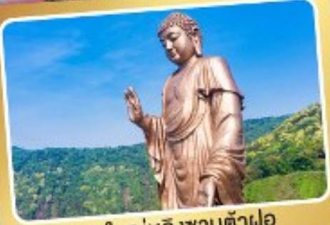
พระใหญ่หลิงซานต้าฝอ