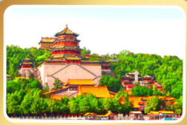
พระราชวังฤดูร้อนอ้อเหอหยวน