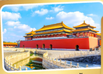
พระราชวังโบราณกู้กง